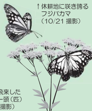
↑ 休耕地に咲き誇る フジバカマ (10/21 撮影)