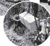
瀬戸田地域 (中野地区)