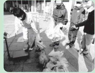
ごみの重量を計測中

12月1日(金)しまなみ交流館前で、「ポイ捨て禁止市民の集い&年末不法投棄防止キャンペーン」セレモニーを開催しました。ポイ捨てや不法投棄ごみの増える年末を控え、“きれいな町 おのみち”の実現を呼びかける恒例行事です。地区公衛協役員と環境指導員をはじめ昨年に続き土堂小学校児童も参加して、総勢約125名での開催となりました。