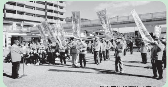
年末不法投棄防止宣言

美しく住みよい町・尾道を、私たちみんなの力で創り出し、育み、保ち続けていきましょう！