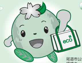
尾道市公衛協の 環境キャラクター “エコろん”です