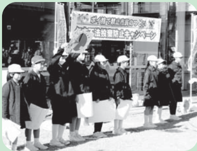
土堂小学校児童の学習発表

近隣地区公衛協と土堂小学校児童(5年生44名)は、地区内や会場までの道すぐらにある散乱ごみの回収活動も実施。集まったごみの総重量は、ポイ捨てされたビン・缶類、落ち葉も含めて25.3kgにものぼりました。ごみの多さ自体は喜ばしいことではありませんが、こうした活動を目にされた市民の皆さんに「きれいな町づくり」の意識が根づくことを期待しています。