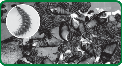
飼育水槽でカワナを捕食するゲンジボタルの幼虫

子どもたちに 藤井川を守る会と尾道市公衆衛生推進協議会では、藤井川流域の小学校児童にゲンジボタルの幼虫を観察してもらうため、環境資源リサイクルセンターで幼虫を飼育しています。毎年、6月上旬に藤井川流域の6地区公衛協の役員で成虫を捕獲し、リサイクルセンターで卵から終齢幼虫になるまで育てます。年が明けて2月頃、小学校で観察してから児童の手で元の川に放流します。